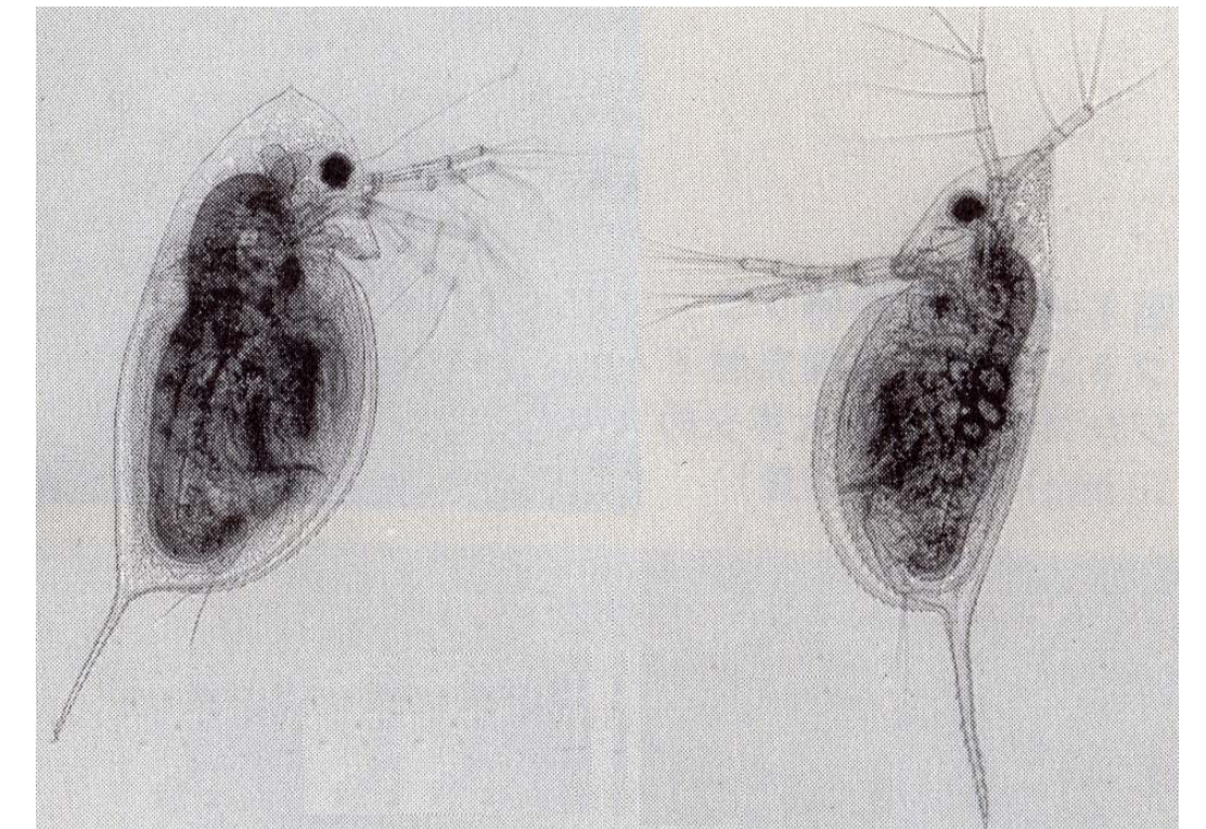
通常の頭部形態のカブトミジンコの幼体(左)と 実験室内でフサカのにおい物質にさらされた同種の幼体（右、高くとがった頭を持つ）

捕食者に食われにくくなる半面、フサカの臭い物質をふくむ水で飼われたミジンコは成熟までにより長い時間を要し、体のサイズが小さくなりました。